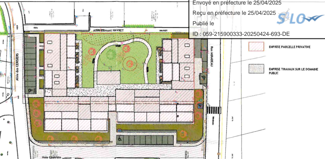
Plan Masse Travaux Echelle 1 : 500

3 entrées collectives 7 entrées individuelles